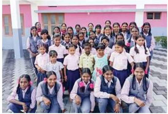
Le bambine accolte nell'Istituto di Kanthalloor