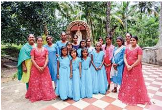
Le bambine accolte nell'Istituto di Undancode