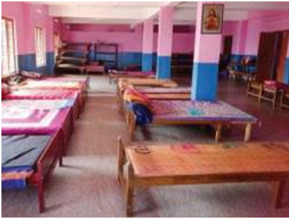
Dormitorio di Kanthalloor