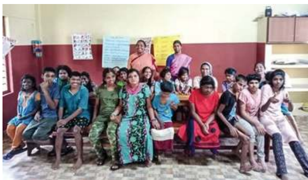
I ragazzi accolti nel Centro Sneha Bhavan