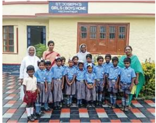
I bambini accolti nell'Istituto Keezanthoor

Durante il suo viaggio a Munnar, Letha ha visitato un altro Istituto dove anche noi eravamo stati una volta negli anni passati, ma che subito dopo era stato chiuso per carenza di Suore. Per questo motivo, fino ad ora non abbiamo attivato alcuna collaborazione. Alla ripresa dell'anno scolastico, nel giugno 2023, un funzionario dei Servizi per l'Istruzione Giovanile ha richiesto alle Suore di riaprire questo Collegio, poiché alcuni bambini avevano necessità di trasferirsi lì, poiché la loro scuola era stata chiusa. Le Suore hanno accolto la richiesta e si sono ridistribuite tra gli Istituti di Kanthalloor, di Marayoor e di Keezanthoor. Purtroppo, però, non hanno mezzi sufficienti per le necessità quotidiane e le famiglie, essendo poverissime, non possono in alcun modo contribuire alle spese. Hanno richiesto a Mille Soli la possibilità di ricevere un contributo per il sostentamento dei 15 bambini ora presenti. In questo modo l'anno prossimo potrebbero soddisfare anche altre richieste di ammissione che, invece, al momento non hanno potuto accettare per mancanza di fondi. Anche in questo Istituto mancano i materassi e i bambini, tutti piccolini, sono costretti a dormire su letti di metallo, sfidando il freddo della montagna.