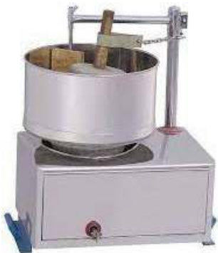
Macina per Istituto Keezanthoor

Mille Soli provvederà ad acquistare materassi, dello stesso tipo previsto per l'Istituto Kanthalloor. Ci è stato richiesto anche l'acquisto di un "grinder", cioè una sorta di macina che, nelle Comunità indiane, è tra gli utensili più utilizzati, indispensabile per tritare cereali, riso, noci di cocco, ecc.