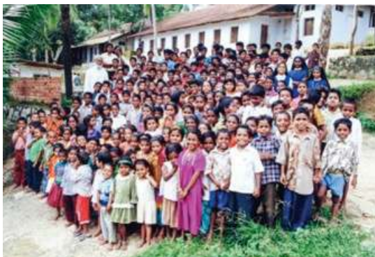
Prima foto di Mille Soli a Navajeevan Anno 2000