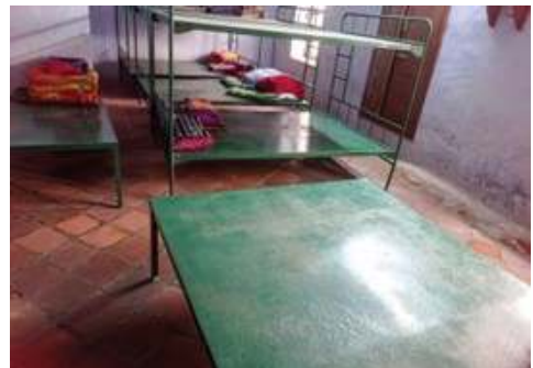
Dormitorio dell'Istituto Keezanthoor