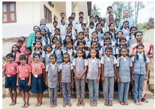
I bambini accolti nell'Istituto Marayoor

Nel Distretto di Munnar, da alcuni anni stiamo sostenendo anche un Istituto nella cittadina di Marayoor. La struttura comprende due distinte sezioni nelle quali sono presenti 32 femmine e 23 maschi. I bambini dimostrano un buon carattere, sono molto affiatati tra loro e frequentano le classi elementari e medie nella scuola adiacente l'Istituto.